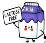
شکه بهداشت و درمان بهارستان

اگر شما بیماری "عدم تحمل لاکتوز" دارید، شیر بدون لاکتوز و یا پنیرهای سفت و ماست استفاده کنید.